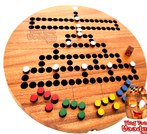
Barricade Malefiz en version tour de plateau de jeu en bois de Monkeypod Thaïlande Chiang Mai