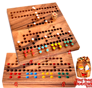
Barrikade Blockade Würfelspiel für die ganze Familie als Holzboard zum klappen mit Spielfiguren und Würfel